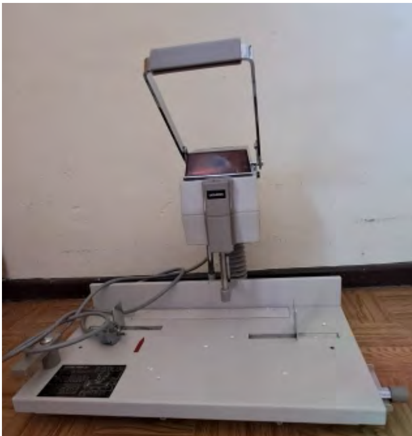
Papierbohrmaschine POK Anschaffung 11/97 1-Spindel-Maschine Funktionstüchtig