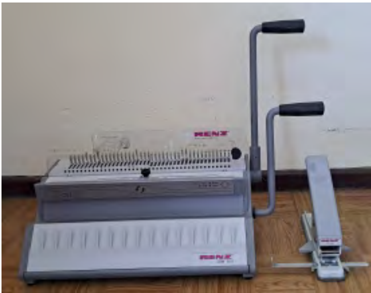
Renz Stanze SRW 360 + Daumenlochstanze TC 20 Anschaffung 2010 Arbeitsbreite 360 mm Funktionstüchtig