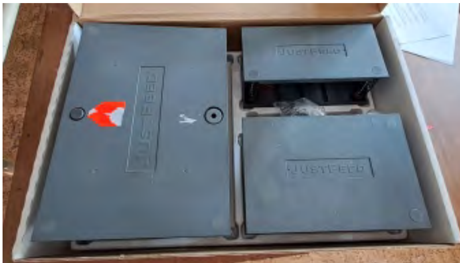
Justfeed Kuvertanleger Anschaffung 6/98 Funktionstüchtig