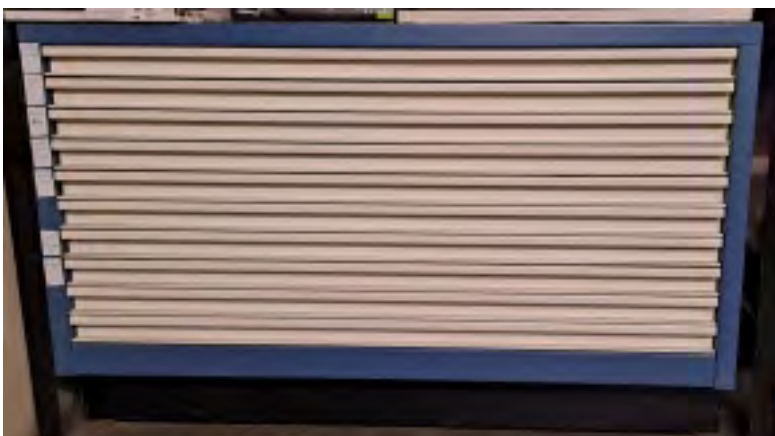
Grafikschrank Metall 100 x 70 x 62 cm 10 Schübe Guter Zustand