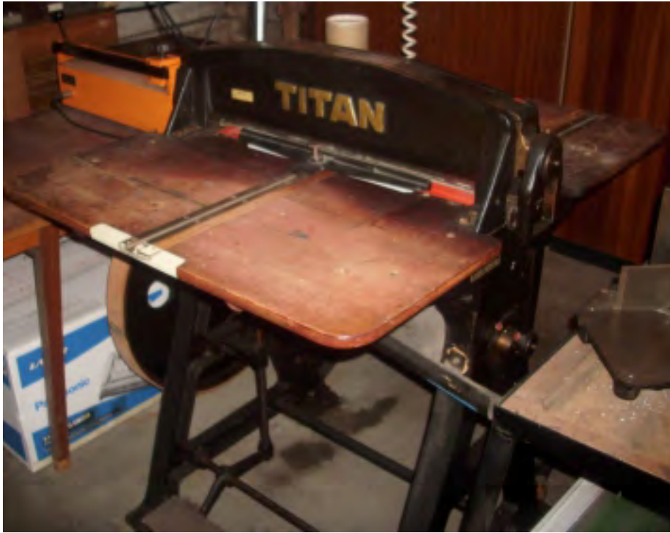
Nut und Rillmaschine Titan - gußeisen Anschaffung 1996 Motorbetrieben, Auslösung durch Fußpedal Mit auswechselbarem Perforierkamm – Rill und Perforierbreite 60 cm Funktionstüchtig