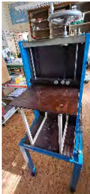
Blockleimpresse mit Heizung Anschaffung 1996 Arbeitsbreite 35 cm Funktionstüchtig