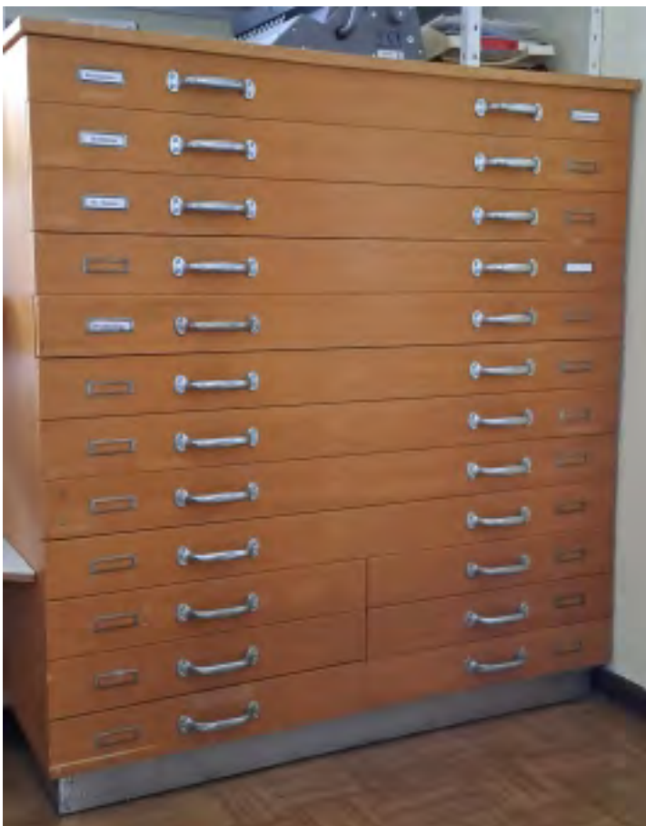
Grafikschrank Holz 112 x 86 x 120 cm 9 ganze Schubfächer 6 halbe geteilte Schubfächer Guter Zustand