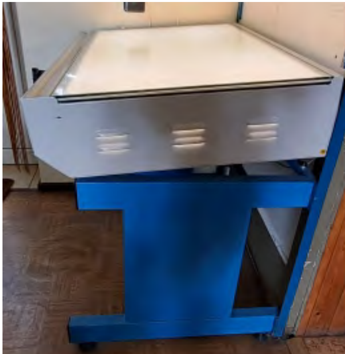
Leuchttisch verstellbar Anschaffung 09/90 100 x 70 cm Arbeitsfläche Funktionstüchtig