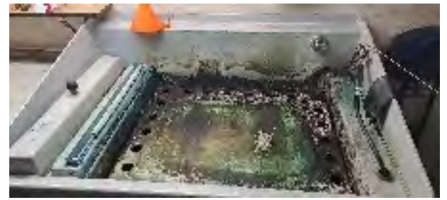
Entwicklerbecken mit Kuvette Anschaffung 12/93 Funktionstüchtig – zu verschenken