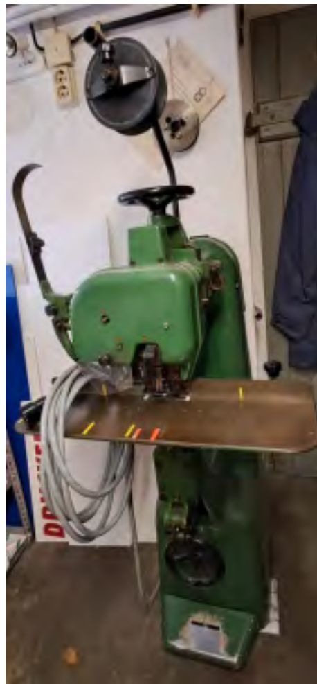
Drehtheftmaschine (Klopfer) Bremer Leipzig Anschaffung 1996 Funktionsfähig