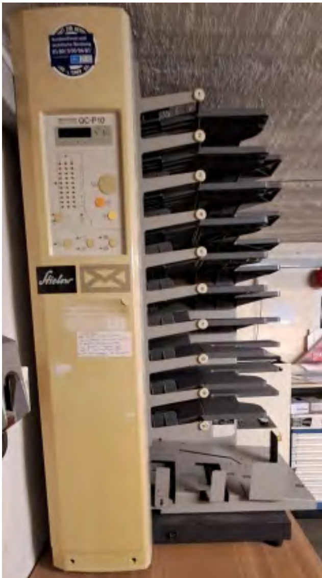
Zusammentragturm Horizon QC/P10 Anschaffung 12/94 10 Stationen, Vordere-, hintere Auslage wählbar Funktionstüchtig