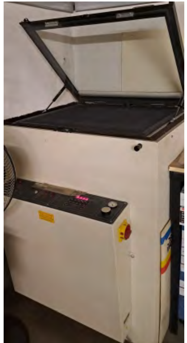
Variocop Kopierrahmen – Technigraf Anschaffung 08/92 Druckplattenkopie Kontakkopie Film Funktionstüchtig