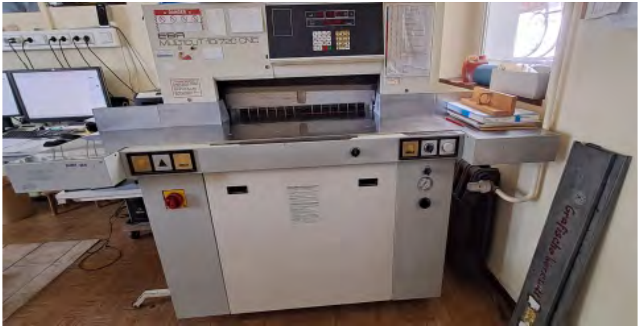
Schneidemaschine EBA Anschaffung 12/93 Schneidbreite 72 cm Funktionstüchtig – zu verschenken