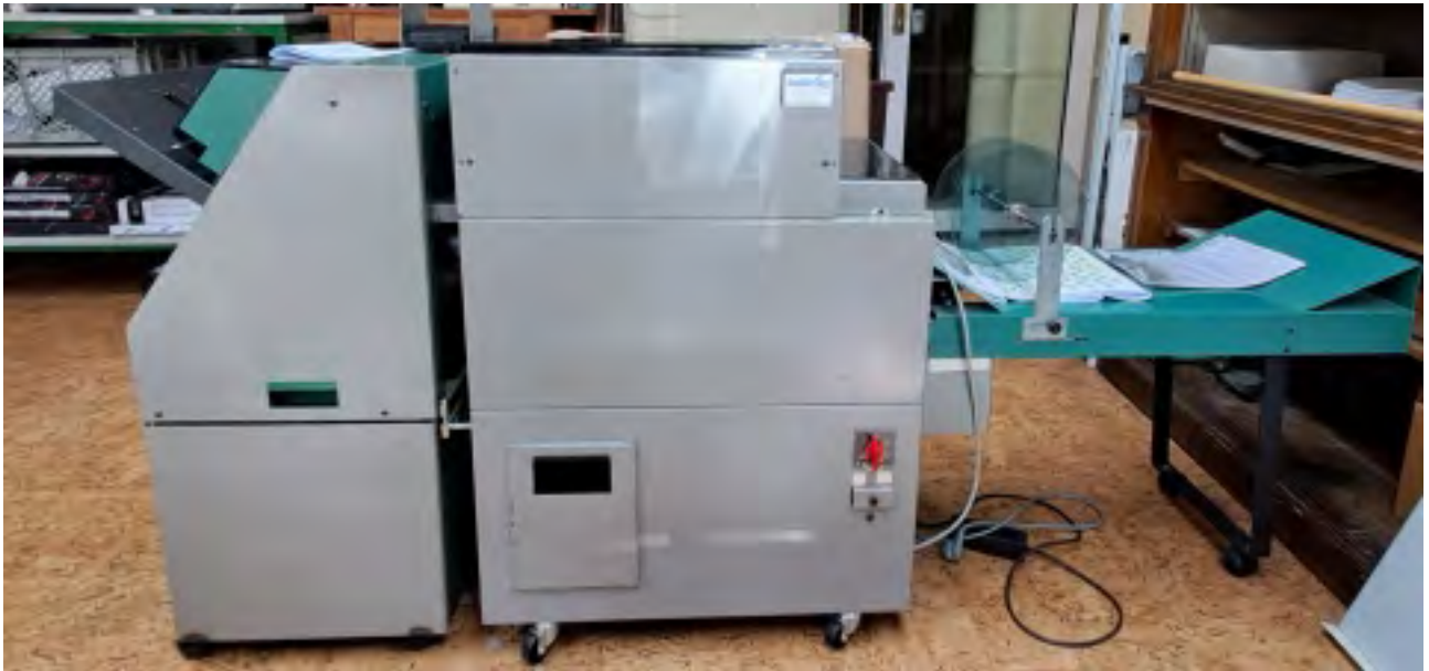
Broschürenheftung „Nagel foldnak-2“ mit Trimmer Anschaffung 2010 Funktionstüchtig